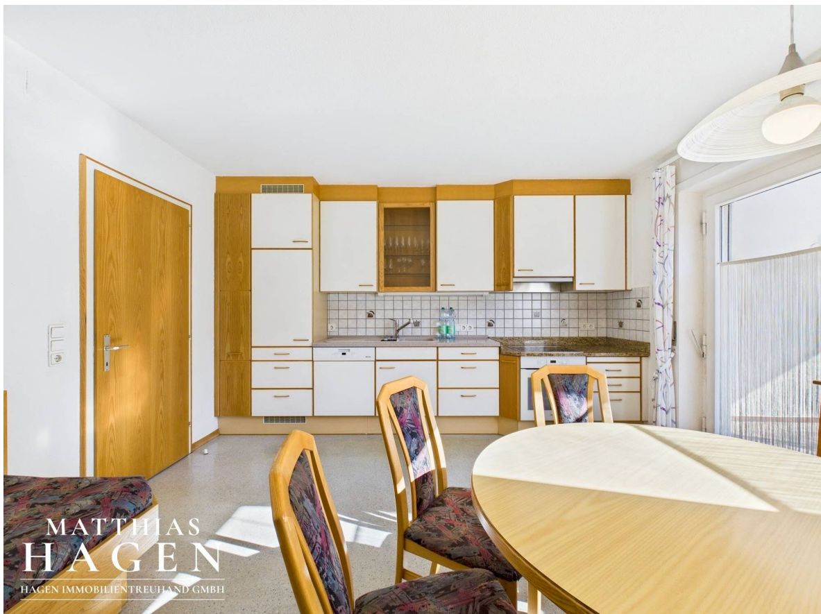
Küche Top 1