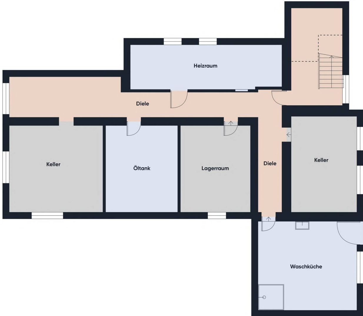
Grundrissplan ohne Maßstab KG