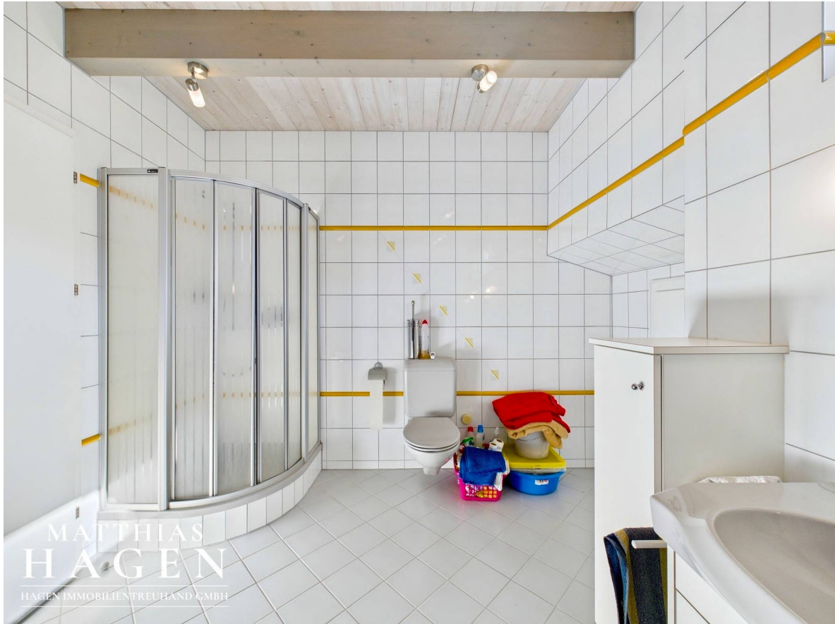
Bad Top 2