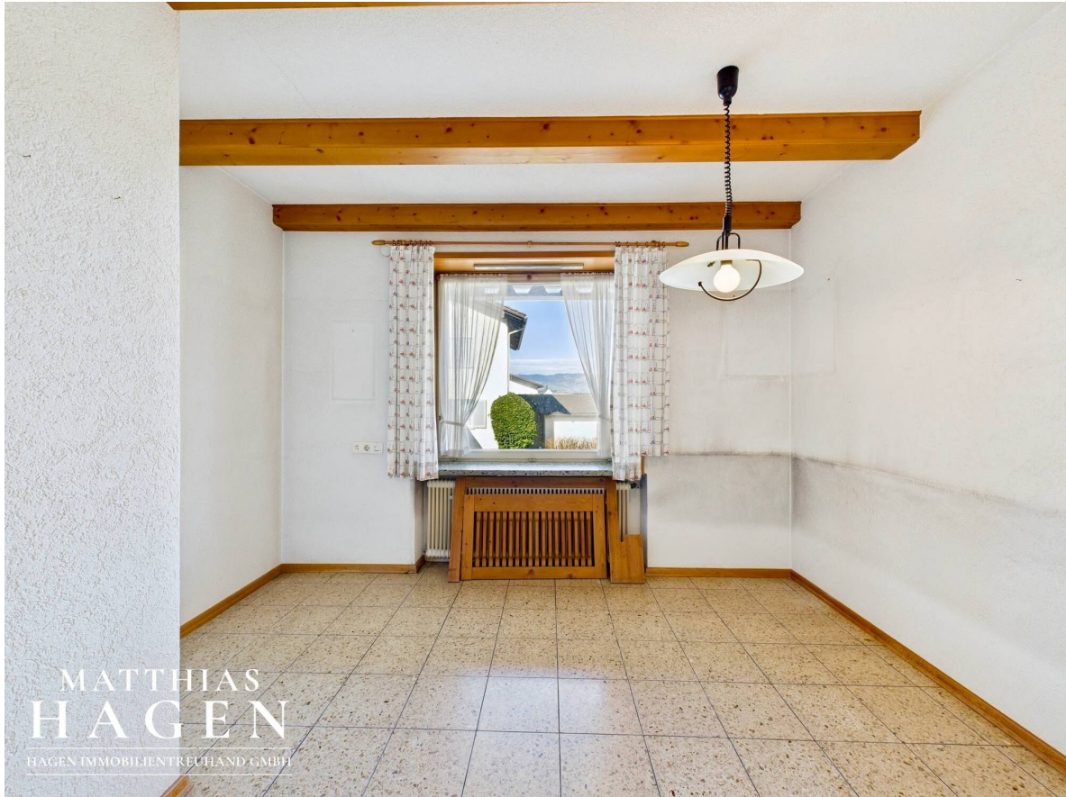
Flur Essbereich Top 1