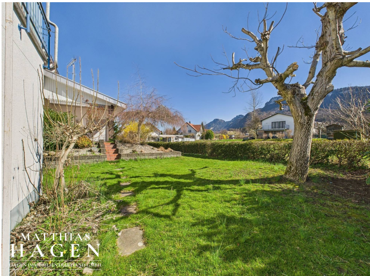
Garten Top 1