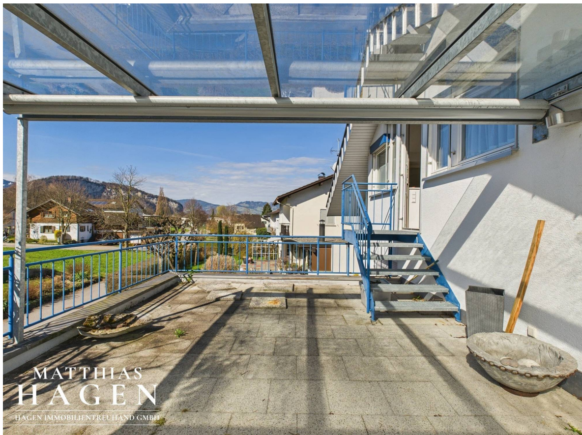
Terrasse Top 2