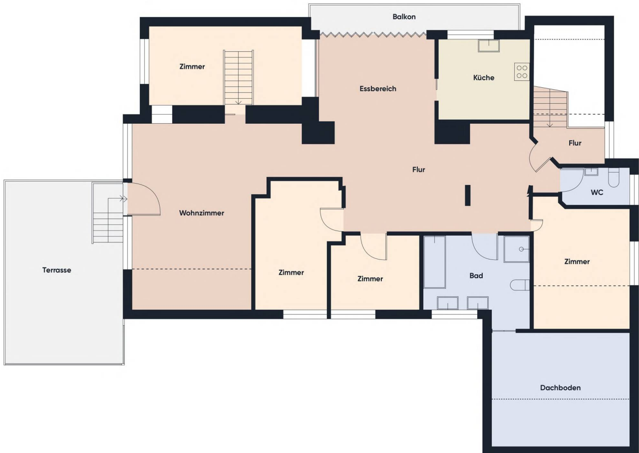
Grundrissplan ohne Maßstab OG