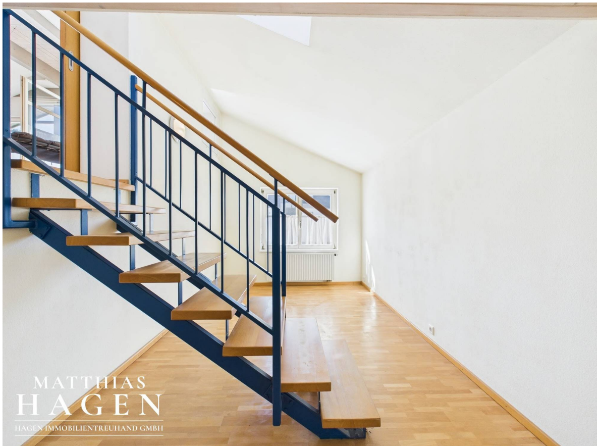
Zimmer 1 Top 2