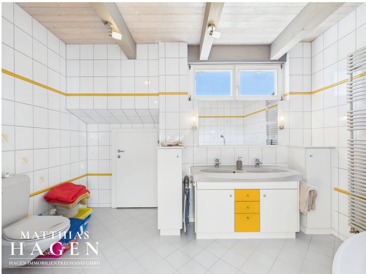
Bad Top 2