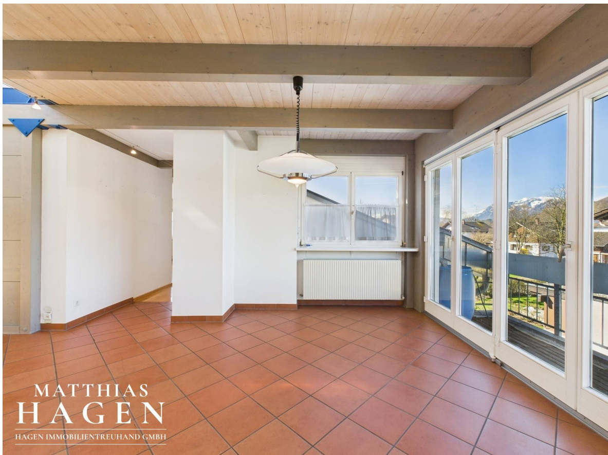
Essbereich Top 2