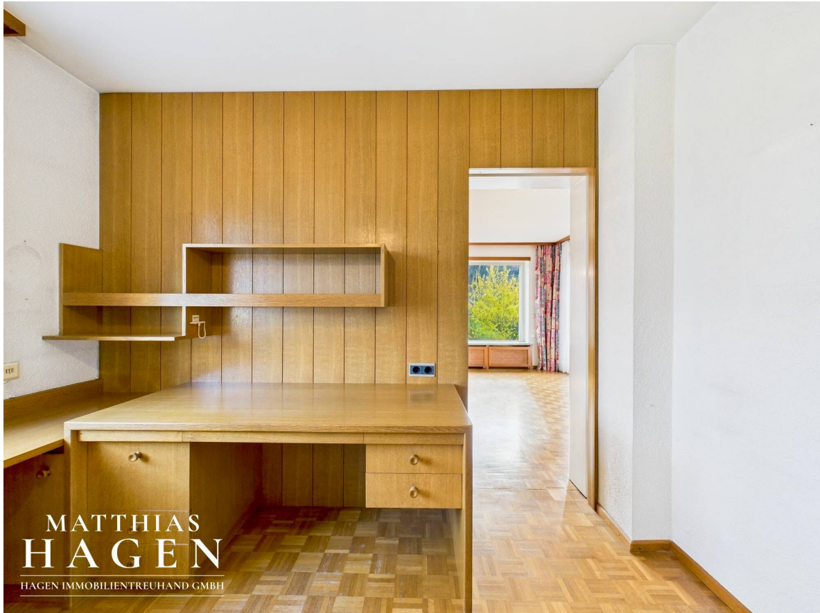
Zimmer 1 Top 1