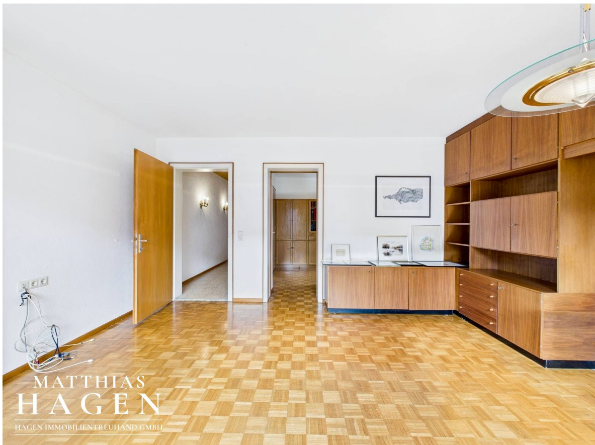
Wohnzimmer Top 1