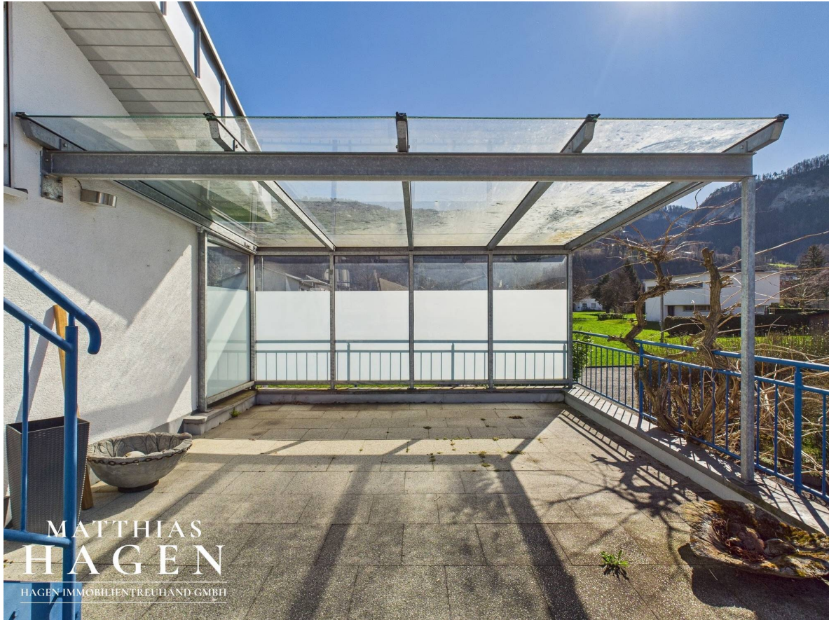
Terrasse Top 2