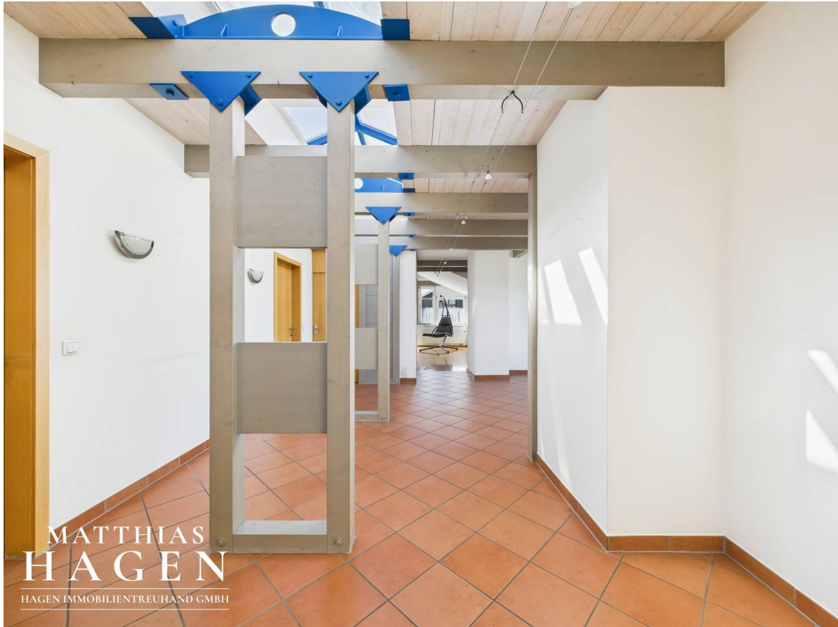
Flur Top 2