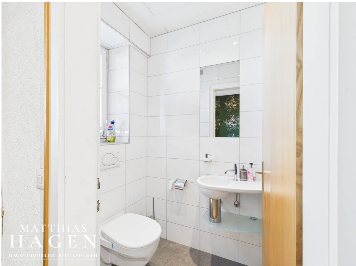
Separates WC Top 1