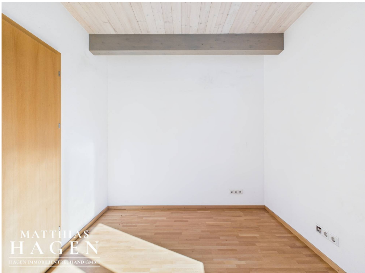
Zimmer 3 Top 2

MATTHIAS H A G E N HAGEN IMMOBILIENTREUHAND GMBH