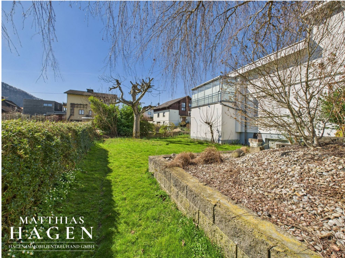
Garten Top 1