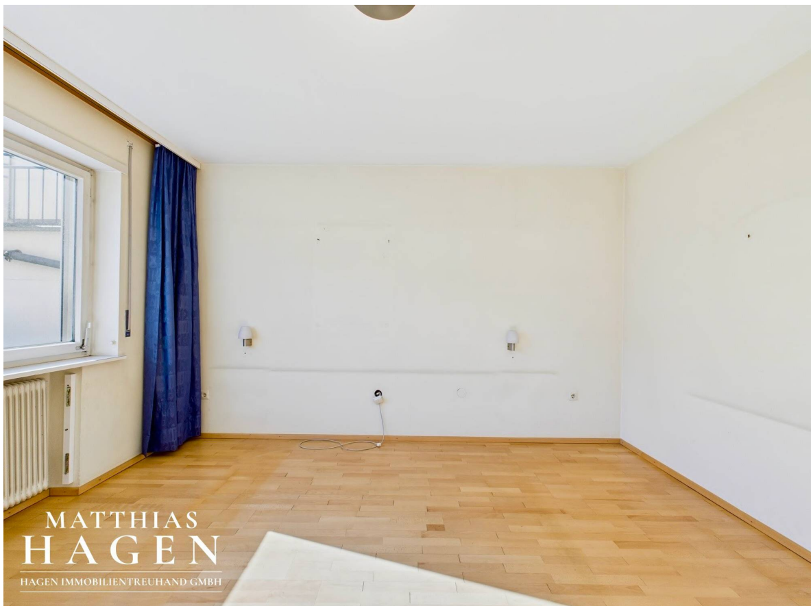
Zimmer 2 Top 1