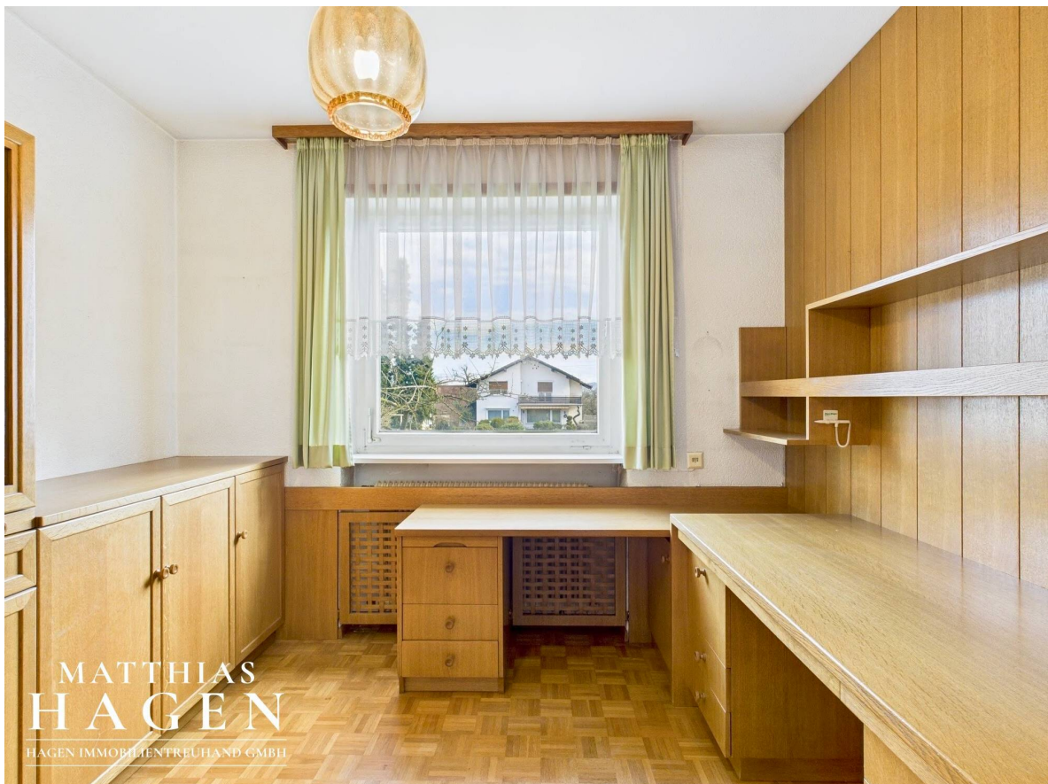
Zimmer 1 Top 1