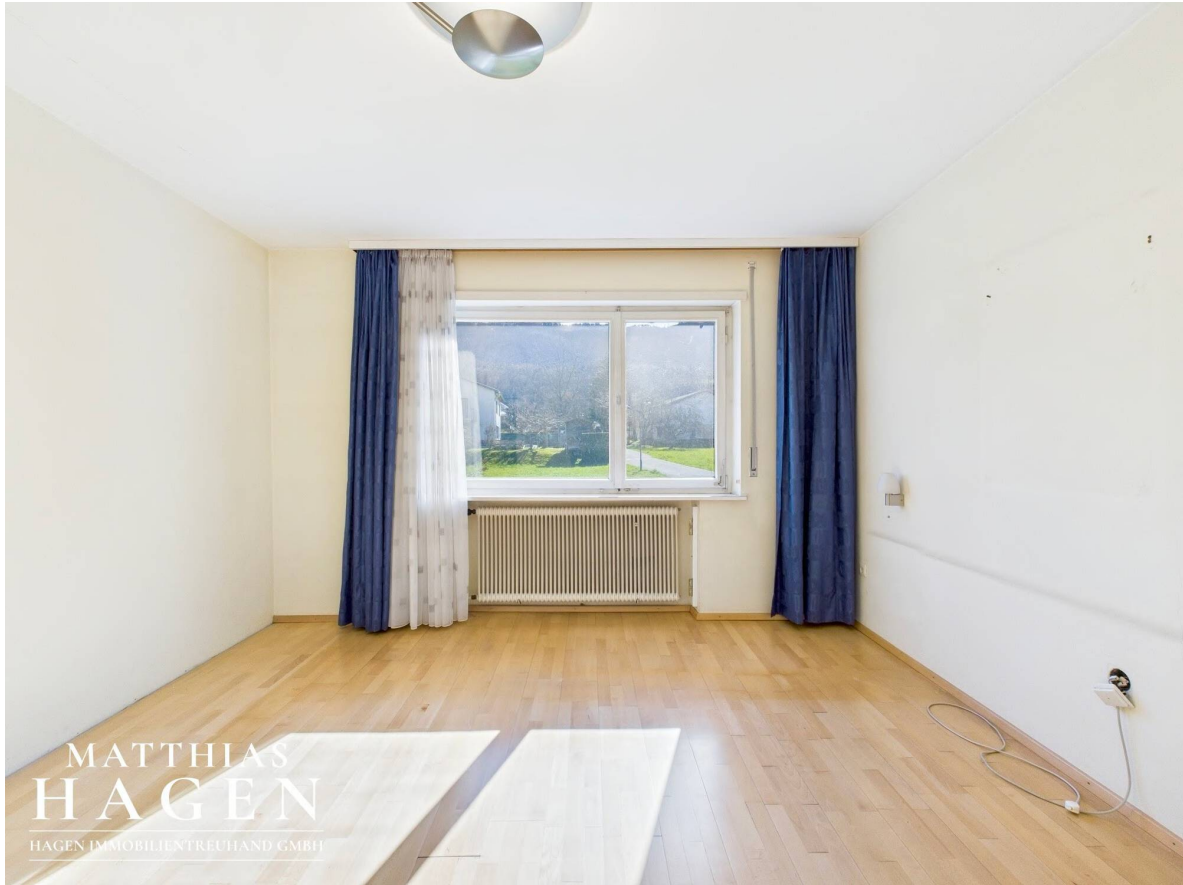
Zimmer 2 Top 1