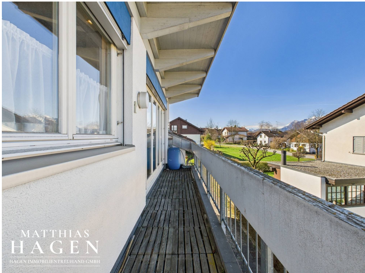
Balkon Top 2