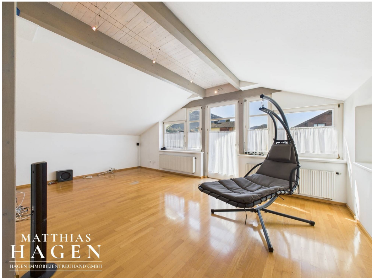
Wohnbereich Top 2