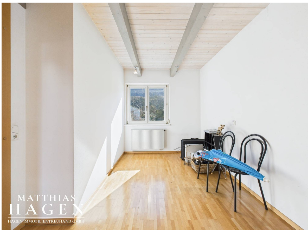
Zimmer 2 Top 2