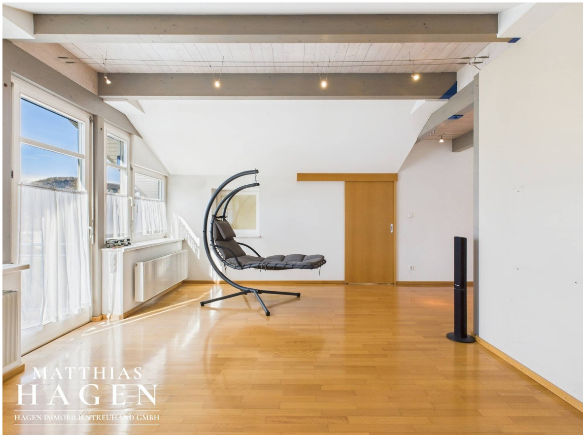
Wohnbereich Top 2