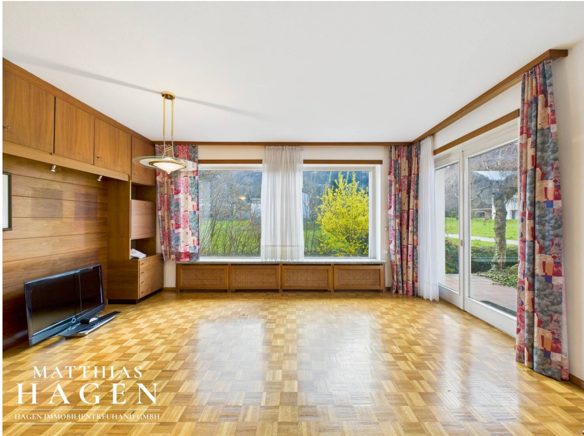
Wohnzimmer Top 1