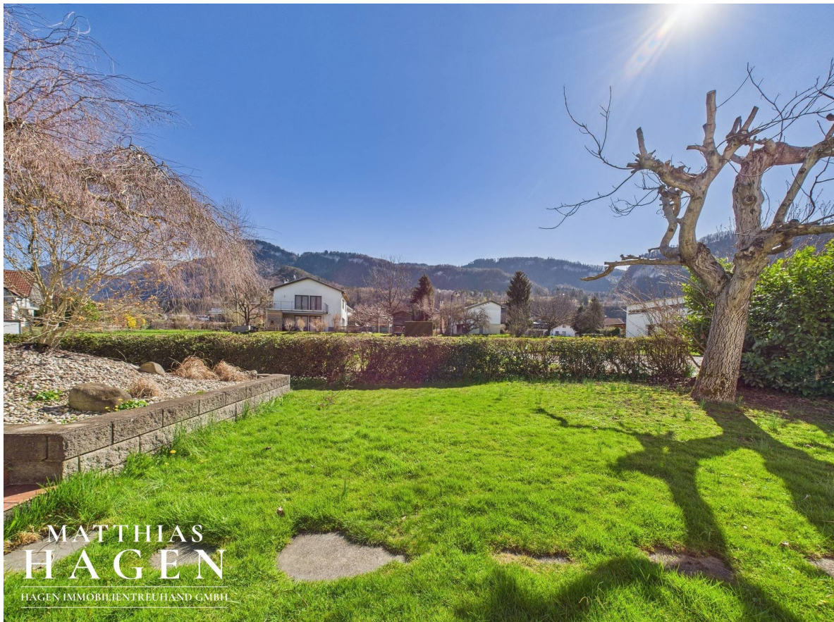
Garten Top 1