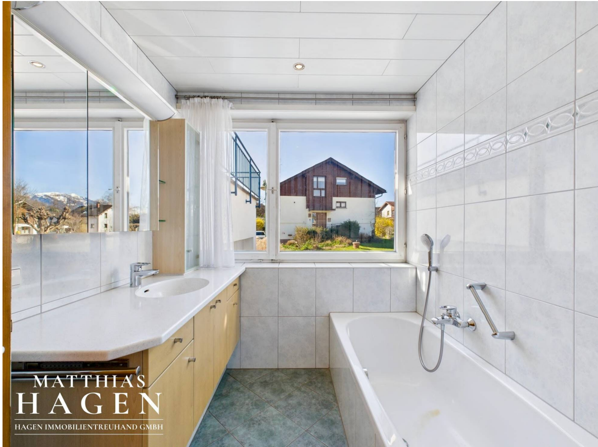
Bad Top 1