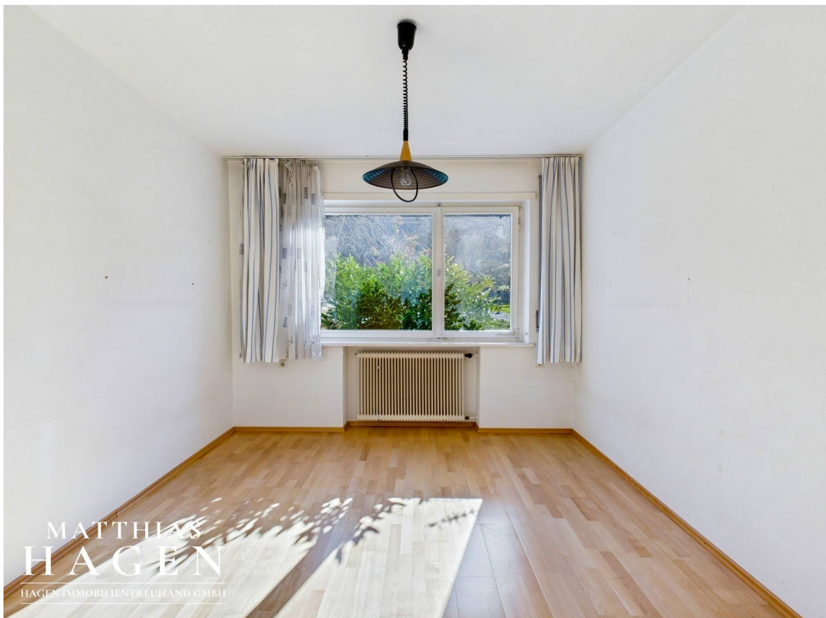
Zimmer 3 Top 1