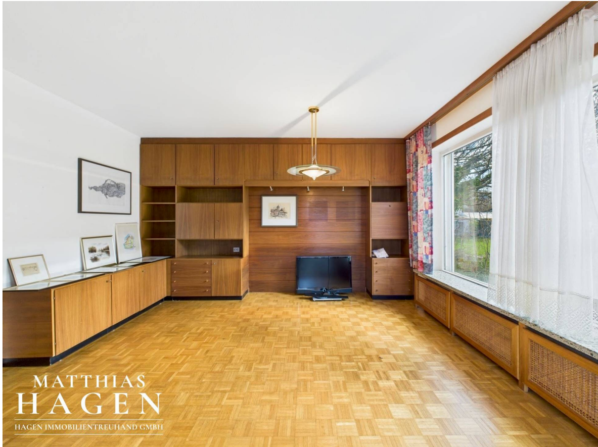
Wohnzimmer Top 1