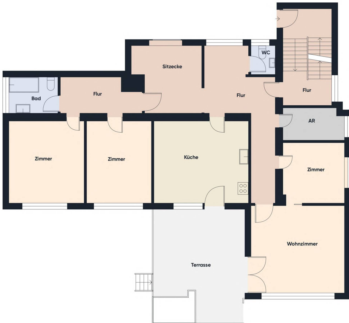
Grundrissplan ohne Maßstab EG