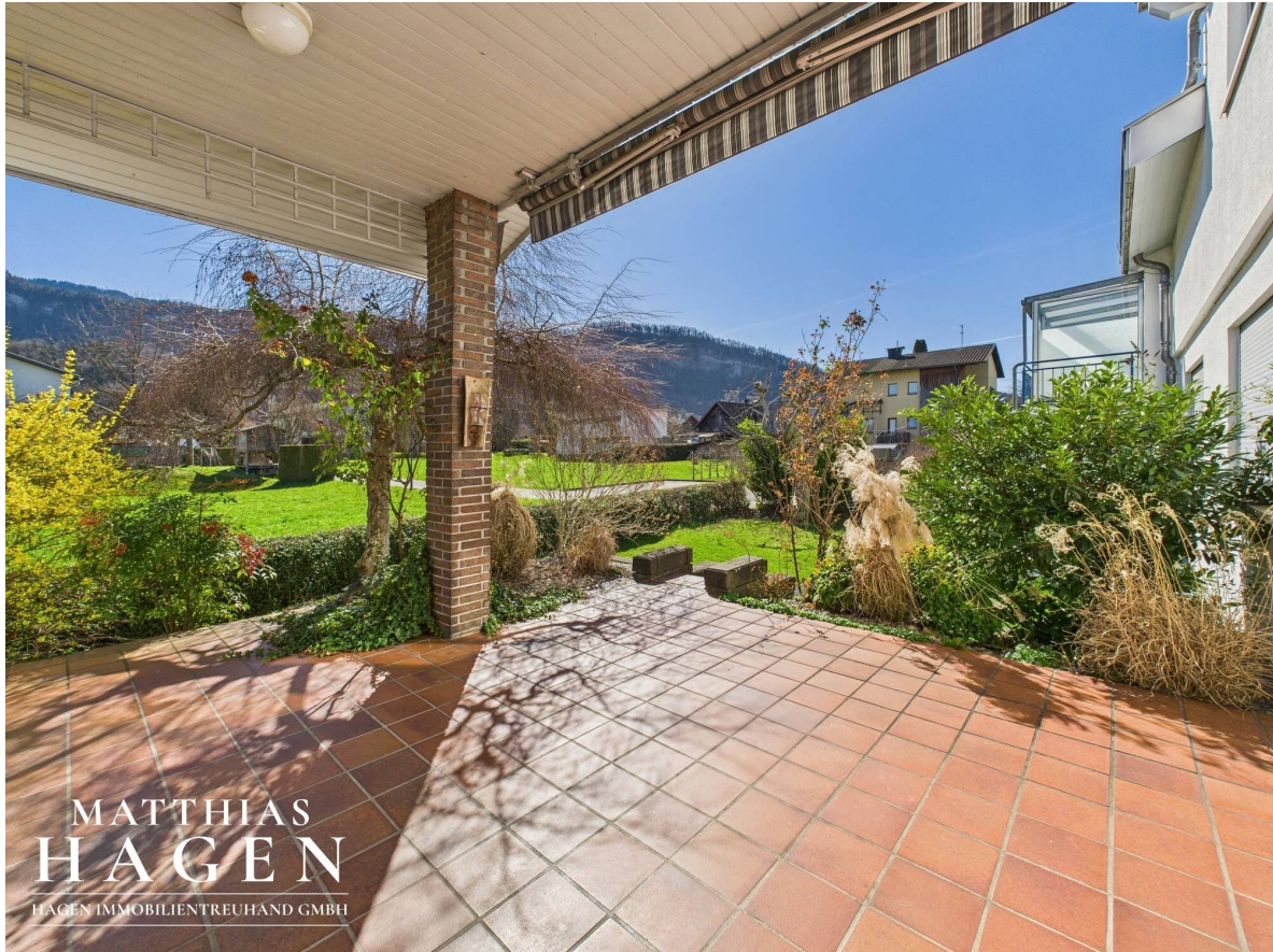
Terrasse Top 1