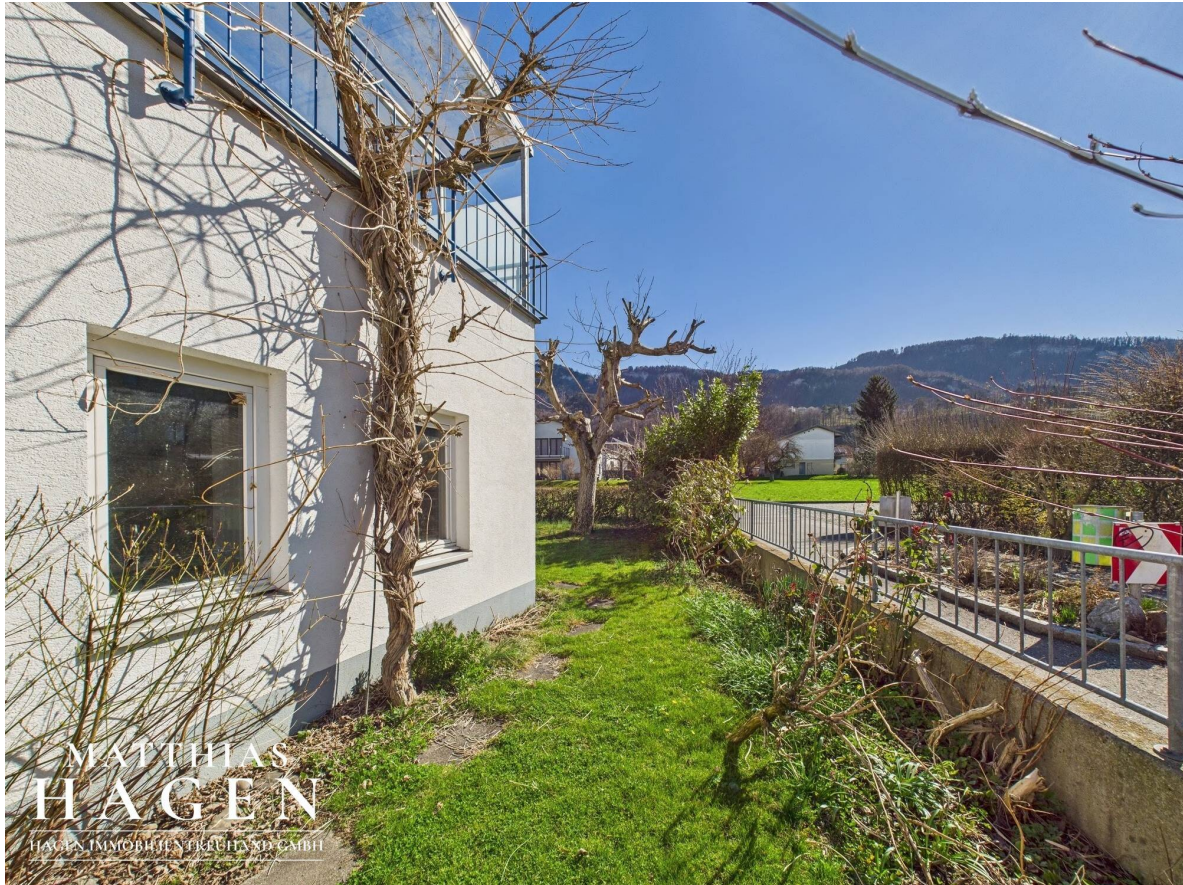
Garten Top 1