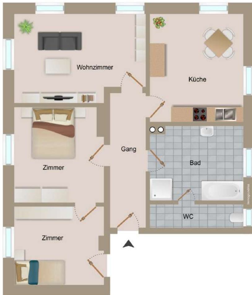
Grundriss ohne Maßstab